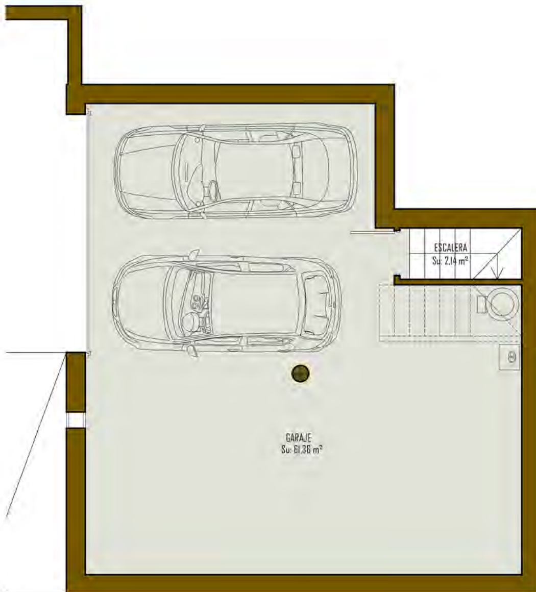
CUADRO DE SUPERFICIES VIVIENDA TIPO "A2.1"