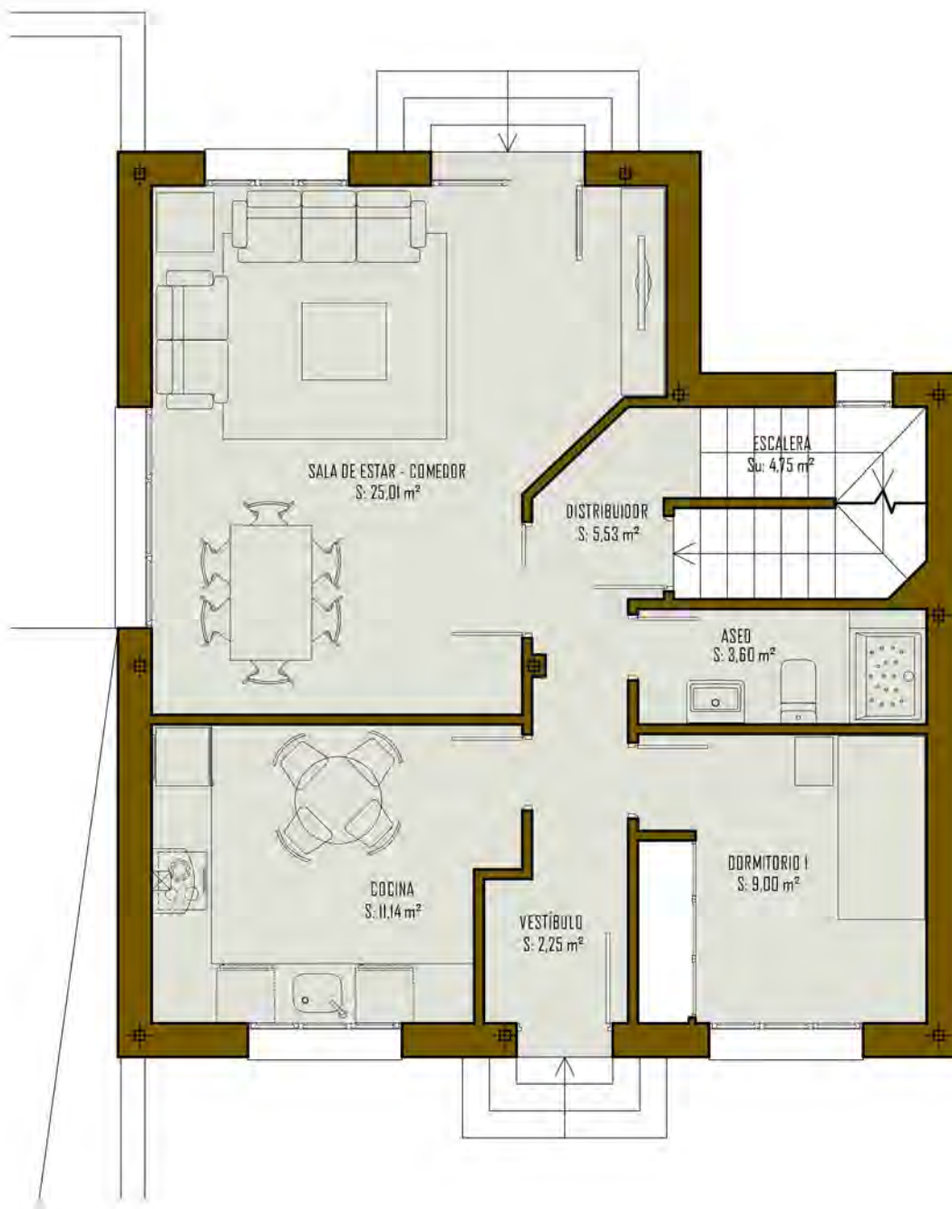
CUADRO DE SUPERFICIES VIVIENDA TIPO "A2.1"