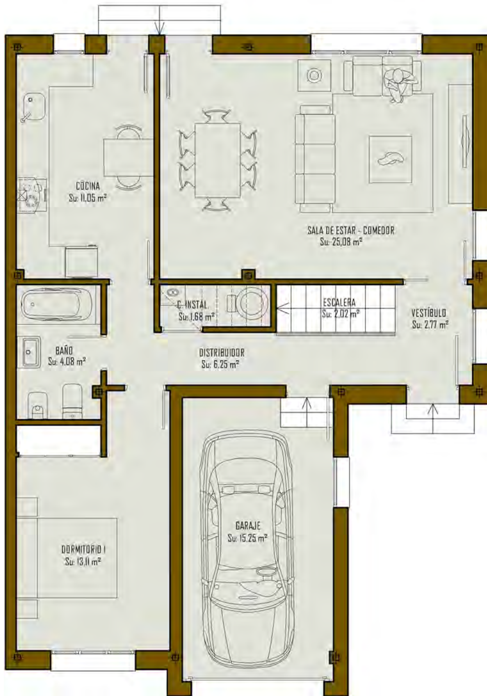
CUADRO DE SUPERFICIES VIVIENDA TIPO "BI"