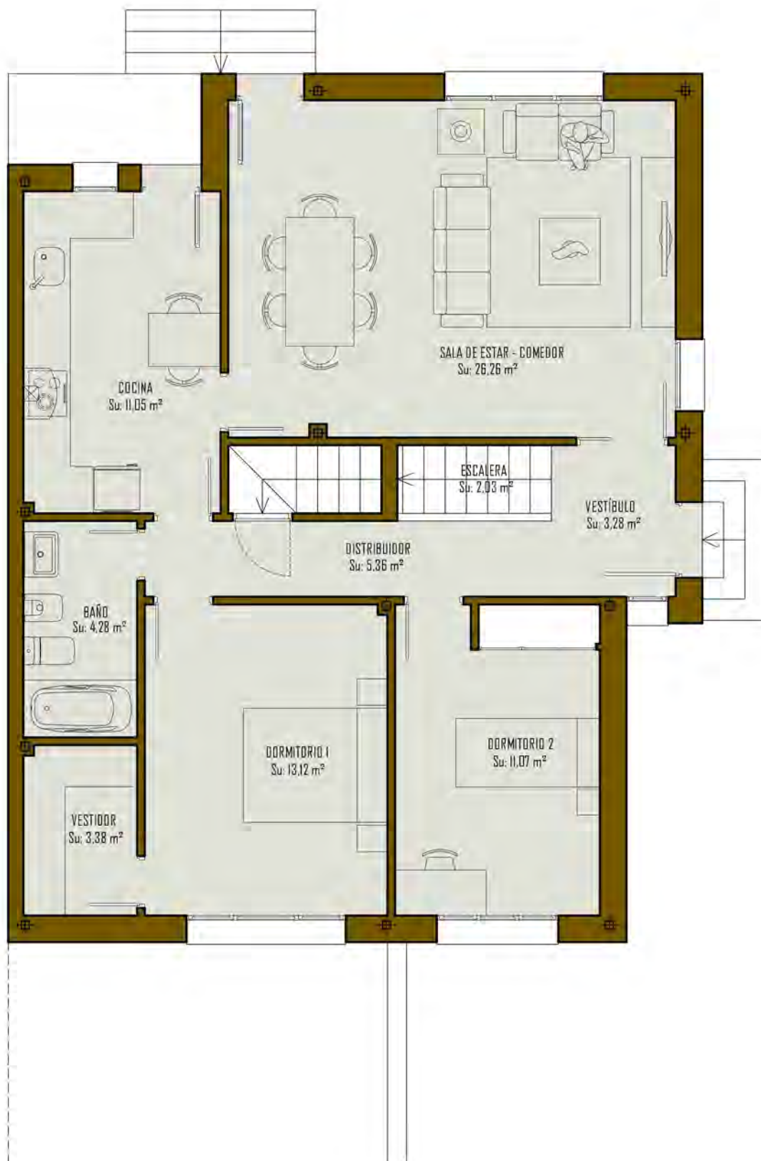
CUADRO DE SUPERFICIES VIVIENDA TIPO "B3"