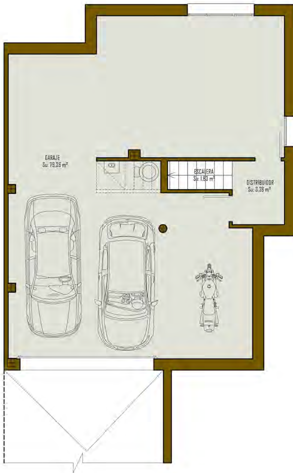
CUADRO DE SUPERFICIES VIVIENDA TIPO "B3"