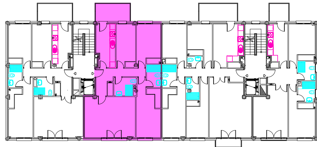
Calle Procuradores de la Tierra