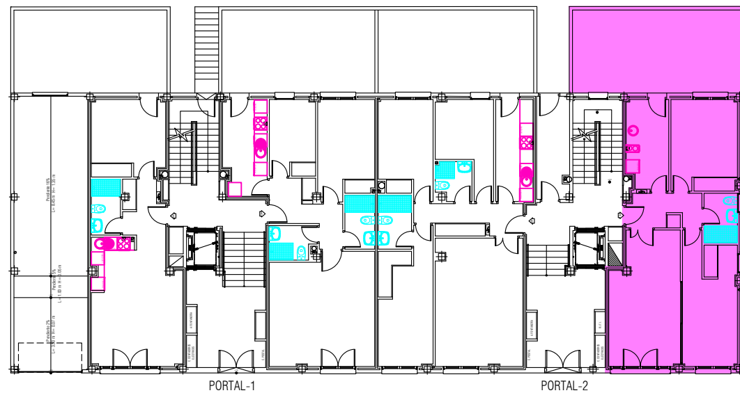
Calle Procuradores de la Tierra