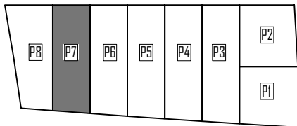
CUADRO DE SUPERFICIES VIVIENDA 7