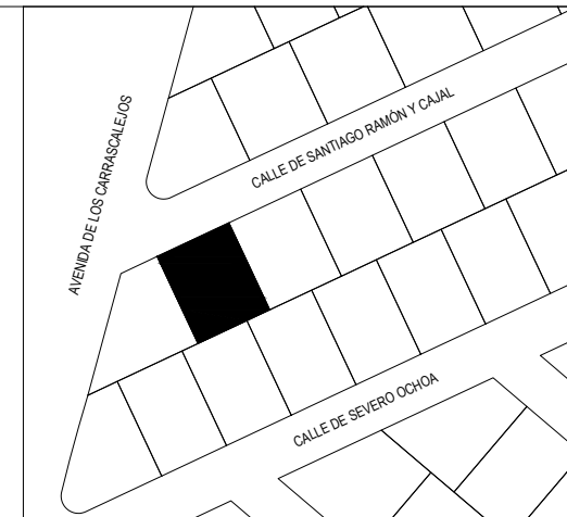
CUADRO DE SUPERFICIES