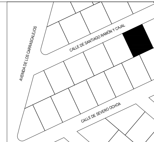
CUADRO DE SUPERFICIES